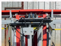
EN OPTION Réglage de l'écartement manuel ou hydraulique