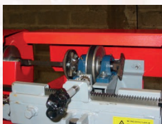
Transmission par courroies